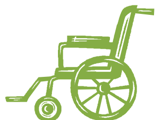
Table jeunesse Beauce-Sartigan

Vous pouvez vous procurer un formulaire en vous présentant au bureau municipal, en allant dans le site Internet de la municipalité ou en téléphonant au 418 227-4147